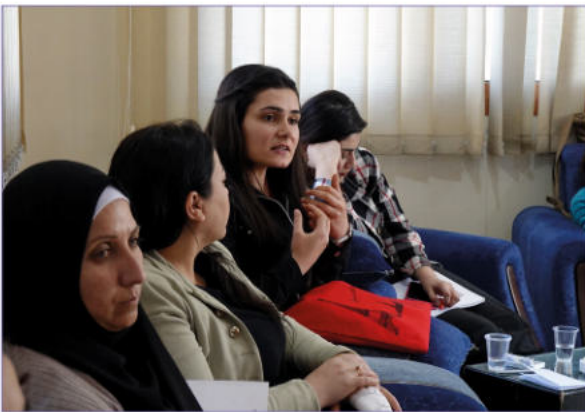
Fortbildung zu Traumapädagogik in Qamişlo im März 2025

Auch 2025 wurden in den Büros der Stiftung und in Gemeindezentren in Dörfern theoretische Bildungsangebote zu zentralen gesellschaftlichen Themen durchgeführt wie z.B.: Frauenrechte, die demokratische Familie, die politische Teilhabe von Frauen, Gewalt gegen Frauen, Kinderehen und Polygamie sowie zum Thema gegenseitige Akzeptanz und Respekt. Es gab auch Fortbildungen zur Stärkung von Frauen in Führungspositionen sowie Schulungen in den Bereichen Psychologie und Pädagogik.