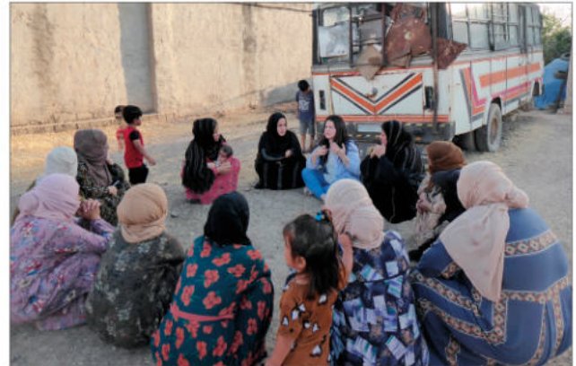
Seminar zu Kinderkrankheiten in der Umgebung von Dêrik

zu vermitteln. Behandelt wurden Themen wie Infektionskrankheiten, Menstruation, Anatomie und Körperfunktionen, Brustkrebs sowie Gebärmutter- und Eierstockkrebs, Grippe, persönliche Hygiene, Leishmaniose (eine Hauterkrankung aufgrund von Mangelernährung und/oder verschmutztem (Trink-)Wasser), Cholera, Kinderkrankheiten und Kinderernährung. Es gab auch Seminare zu: natürliche Geburt, Stillen und der Einsatz von Naturmedizin. Auch 2025 wurden wieder Erste-Hilfe-Kurse durchgeführt.