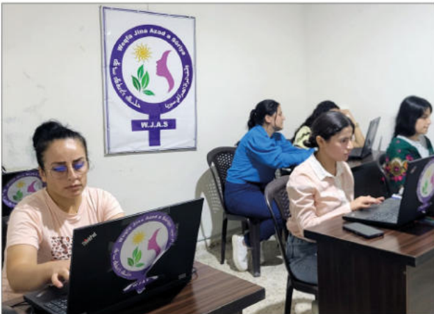
Computerkurs in Aleppo