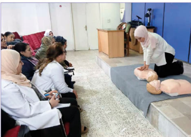
Fortbildung zu Notfallmedizin im Rahmen der Klinikpartnerschaften

Im Jahr 2025 hat das Europakomitee zusammen mit WJAS in Syrien und der Städtepartnerschaft Friedrichshain-Kreuzberg – Dêrik einen Antrag bei den Klinikpartnerschaften, einem Projekt der Deutschen Gesellschaft für Internationale Zusammenarbeit (GIZ), gestellt. Im Rahmen der Projektentwicklung wurde nach einer Bedarfsanalyse ein Konzept erstellt zum Erhalt der Mobilen Klinik und Erneuerung des Inventars sowie zu einem zusätzlichen Bildungsangebot, das regelmäßige Seminare zu Gesundheitsthemen sowie Erste-Hilfe-Kurse für Frauen im Umland von Dêrik vorsieht. Außerdem soll im Rahmen vom train-the-trainer Prinzip eine Weiterbildung des medizinischen Personals von WJAS im Dêrik Hospital erfolgen. Der Antrag wurde im Oktober 2025 bewilligt und es wurde sofort mit der Umsetzung begonnen. Bereits in den ersten Monaten der Projektlaufzeit konnten viele Anschaffungen getätigt werden und zahlreiche Seminare sowie ein mehrtägiger Erste-Hilfe-Kurs und eine Fortbildung zu Notfallmedizin erfolgreich realisiert werden. Die Resonanz war sehr gut und die Beteiligten haben von der Teilnahme und der positiven Atmosphäre profitiert.