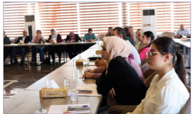
Am 19. Oktober nahmen Vertreterinnen der Frauenstiftung WJAS an der Dialogkonferenz der Demokratischen Islamkonferenz in Qamişlo teil, die unter dem Motto „Nein zum Extremismus – Ja zur Vielfalt“ stattfand.

Im Dezember 2025 fand die Jahresversammlung der Stiftung in Qamişlo statt. Knapp 40 Frauen aus der Leitungsebene aller Stiftungsstandorte kamen zusammen um die Arbeiten zu bewerten und Ziele für 2026 zu formulieren. Die erarbeiteten Überlegungen und Pläne müssen aktuell aufgrund der oben beschriebenen Lage pausieren.