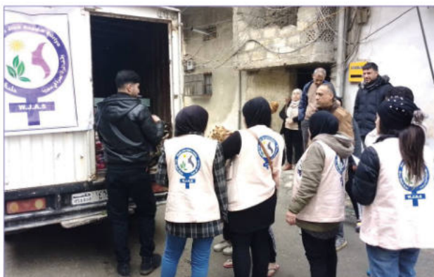
Verteilung von Hilfsgütern an Geflüchtete in Qamişlo 2025

Das Jahr 2025 war für Syrien von anhaltender Gewalt, politischer Instabilität und tiefgreifenden gesellschaftlichen Umbrüchen geprägt. Die islamistische Miliz Hayat Tahrir al-Sham (HTS) festigte ihren Einfluss und bildete nach Assads Sturz eine Übergangsregierung. Diese bemühte sich, ihre Macht durch sogenannte Wahlen zu legitimieren, die